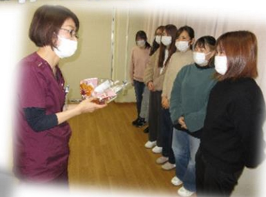
↑担当者から卒年生にプレゼント贈呈の様子