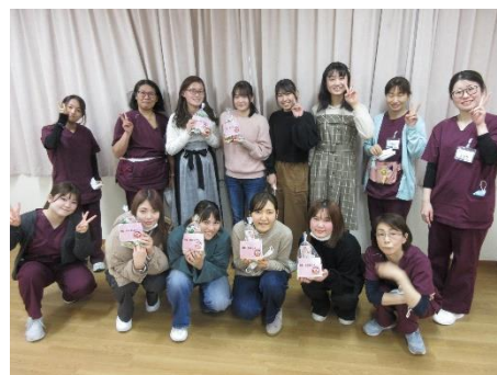
*撮影時のみマスクを外しています