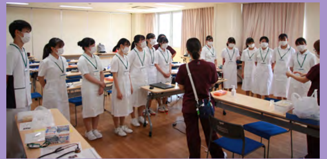
デジタルの血圧計だけでなく、アナログの（アネロイド血圧計）を使ってみんなで血圧測定もしてみました。