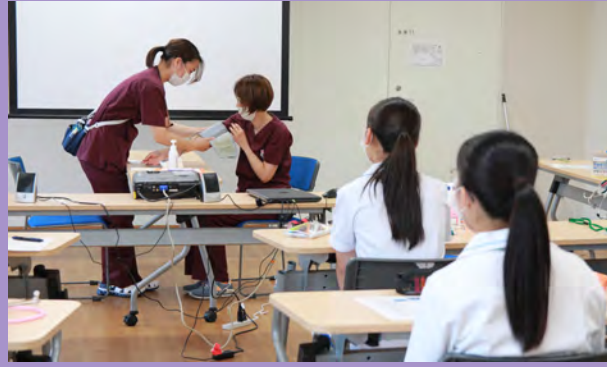
まずは職員が見本を見せます。