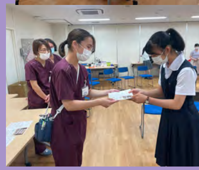
最後には 修了書をもって終わりです！